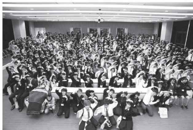
参加者全員が集まってグランドコンテストのGCマーク!!

過去最多124チームのエントリーがあり、最終選考会には2日間で約1,000人もの参加がありました。